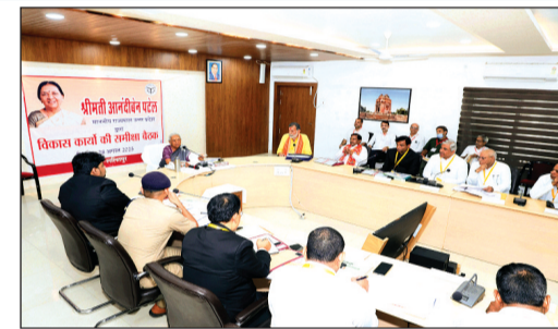
को भी अपने-अपने क्षेत्रों में बाल विवाह, शराब बंदी व महिला शिक्षा के प्रति लोगों को जागरूक करने को कहा। राज्यपाल ने निर्देश दिये कि जलशिकायतों का निस्तारण तत्काल सुनिश्चित किया जाए, साथ ही इसका प्रत्येक विभाग में रिकॉर्ड भी रखा जाए, इसके अलावा जनपद में मतदाता पुनरीक्षण कार्य पूरी गंभीरता के साथ किया जाए, कहीं भी डुप्लीकेसी न हो। उन्होंने कहा कि बाल विवाह एक बड़ी समस्या है, इसकी रोकथाम के लिए अधिकारियों को व्यक्तिगत रूचि लेकर कार्य करना पड़ेगा, ऐसे मामलों में बाल